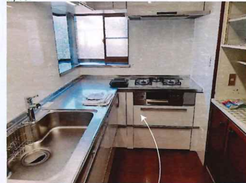
L型キッチンへの取替

こどもみらい住宅支援事業補助金により、 窓交換・床断熱・お風呂・キッチンで 22万円の交付!!