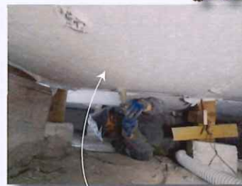
床下断熱セルロース施工