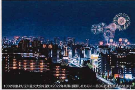
1302号室より淀川花火大会を望む(2022年8月に撮影したものに一部CG合成を施しております) ※写真はHPにてお見せします。実際のお住まいは前後の階と異なる場合があります。 また淀川花火大会等の行事イベントは社会情勢により変更中止になる場合があります。