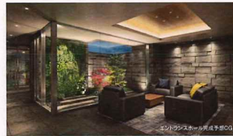
エントランスホール完成予想CG

Osaka Metro 「四天王寺前夕陽ヶ丘」駅徒歩 7分 五条小学校徒歩 1分