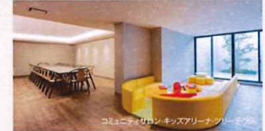
コミュニティサロン、キッズアリーナ、プレイパーク