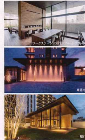
ワークステーション

千里ニュータウン内、駅徒歩4分の地に、堂々竣工。実際の共用部やお部屋を体感頂けます。