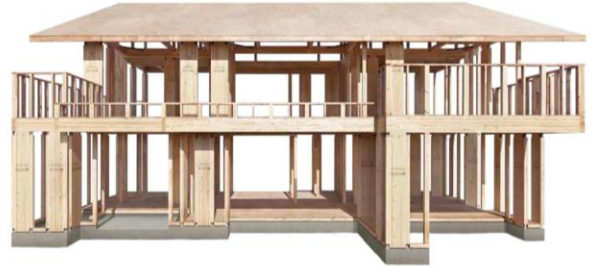
住友林業のビッグフレーム構法

振動実験では、東日本大震災を超える強い揺れを難くクリア。さらに合計246回の加振にも耐え、テクノロジー抜き、繰り返し発生する余震にも強いことが証明されています。webサイト