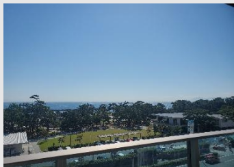
専有部分からの眺望