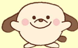
KLCイメージキャラクター「ケルシー」